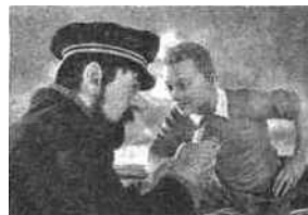
SONY ET WARNER

à Bruxelles propose de suivre les pas de Tintin. Les entrées au Musée Hergé et la carte des lieux de la tintinologie (le parc du Sceptre d'Ottokar , la salle de concert des Sept Boules de cristal , etc.)