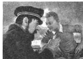
SONY ET WARNER

à Bruxelles propose de suivre les pas de Tintin. Les entrées au Musée Hergé et la carte des lieux de la tintinologie (le parc du Sceptre d'Ottokar , la salle de concert des Sept Boules de cristal , etc.)