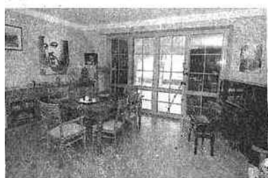
VILLE IN ITALIA

Toute proche, la ville de Pesaro, sur la côte adriatique, possède une riche